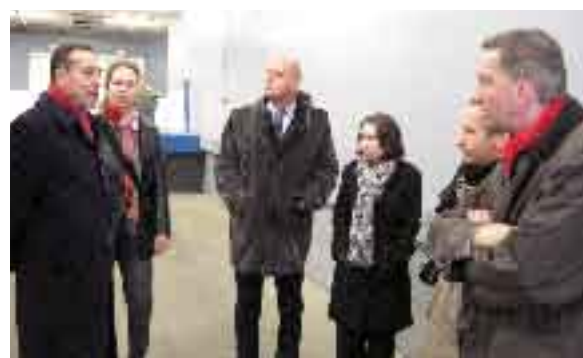
06-03-08 De Commissie op werkbezoek in de binnenstad van Maastricht, hier bij een laad- en losdok.