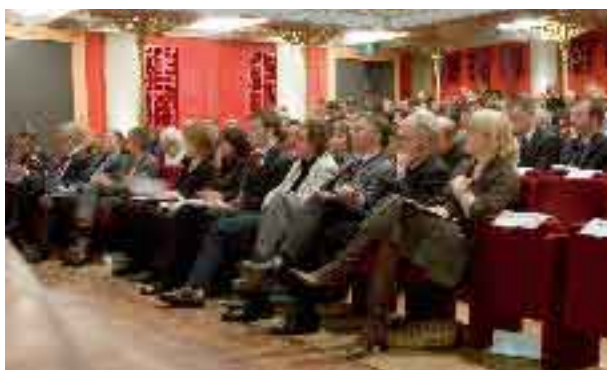
18-11-07 Het goed bezochte congres 'Steden aantrekkelijk, concurrerend en bereikbaar', georganiseerd door de Commissie Stedelijke Distributie en BestuFs.